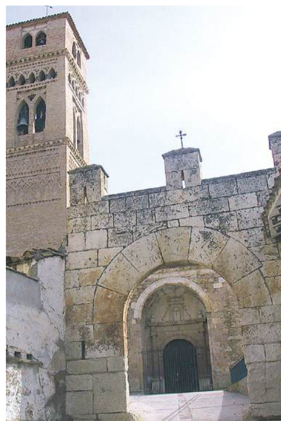
Iglesia de Aniñón