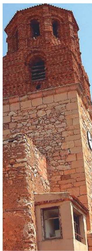
Torre de la iglesia de Campillo