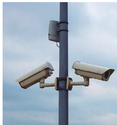
La seguridad es uno de los temas que más preocupa a los ayuntamientos y a la institución provincial.

que recuerda que la Diputación de Zaragoza fue pionera en anunciar un plan de ayudas para videovigilancia. “Después el Gobierno de Aragón y la Diputación de Huesca pusieron en marcha iniciativas similares pero con una dotación económica muy inferior: 400.000 y 100.000 euros, respectivamente, frente a los 2,1 millones que hemos concedido desde la DPZ”, explica el presidente.