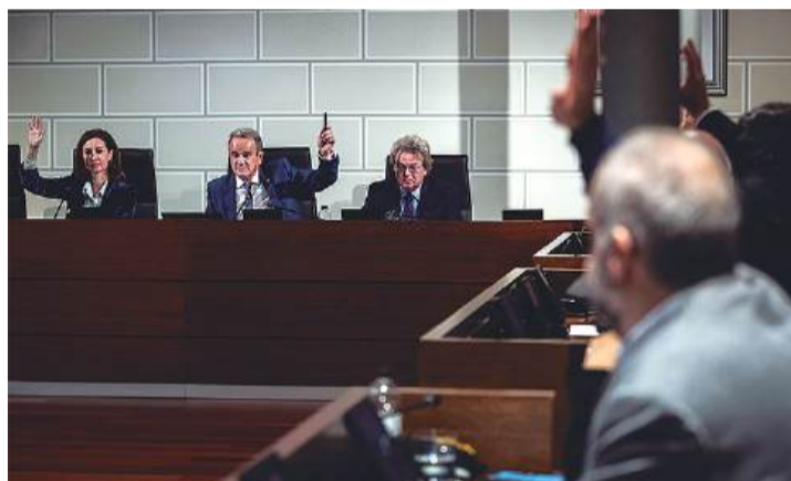
El plan Agenda 2030 se aprobó con el apoyo de todos los grupos políticos de la Diputación de Zaragoza a excepción del Partido Popular que se abstuvo.

“En total, esta nueva convocatoria del plan Agenda 2030 distri-